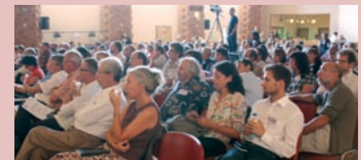
▲ De nombreux participants avaient répondu à l'appel