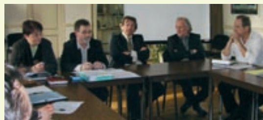
▲ 23 janvier 2009, premier comité de pilotage du Centre de formation multimétiers présidé par le Président de la Communauté de Communes en présence du maire de Coutras et du député.

Lancé par le député lors de la campagne des législatives, le projet de centre de formation multimétiers avance. La Communauté de Communes a recruté un chargé de mission Formation pour définir précisément les besoins des entreprises locales et assurer le montage du projet ●