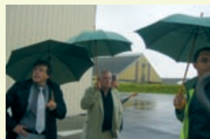
▲ Visite de l'entreprise SCREG en présence du Président de la Communauté de communes de Blaye

>>> Le député poursuit sa tournée de visites d'entreprises. Le 15 juin, il était sur le canton de Blaye pour rencontrer la SCREG, la Semabla, Mauco et le Château Berthenon. Le député a pu échanger sur les difficultés économiques liées à la crise, l'importance des commandes publiques pour le maintien de l'activité, le potentiel ferroviaire du port de Blaye, et sur les projets de développement ●