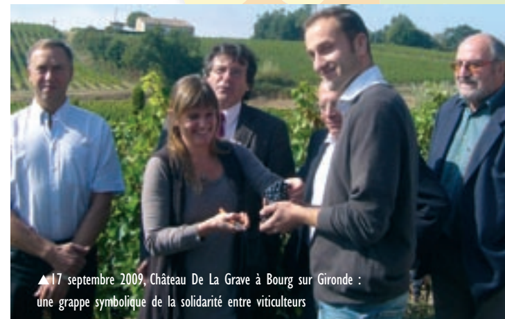
▲ 17 septembre 2009, Château De La Grave à Bourg sur Gironde : une grappe symbolique de la solidarité entre viticulteurs

...et à l'article 24 de la loi Hôpital, Santé, Patient et Territoire (HSPT). Le député de la 11 ème avec ses collègues parlementaires des territoires viticoles a mené le combat auprès des viticulteurs pour la suppression de l'article 24 dans la loi HSPT, interdisant notamment la dégustation. Cette victoire de la raison est venue à point nommé pour reconforter la profession viticole touchée par la crise économique et par les aléas climatiques.