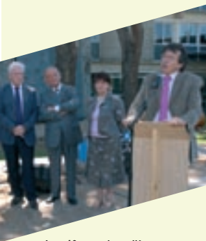
▲ Les 40 ans du collège de Coutras