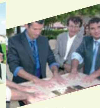
▲ Inauguration de l'aménagement du bourg de Comps