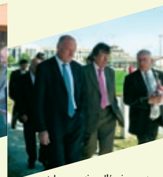
▲ Inauguration d'équipements sportifs à St André de Cubzac