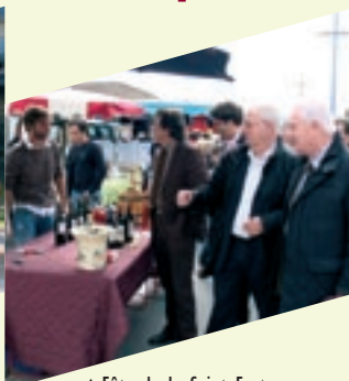
▲ Fête de la Saint Fort à St Denis de Pile